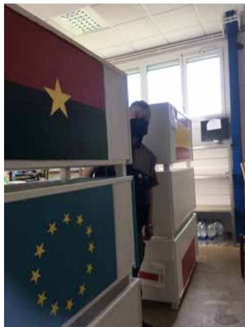
Séances peinture des jardinières. Les jardinières seront installées et inaugurées dans la cour en fin d'année scolaire.

Les parents volontaires et disponibles ont également été invités à partager leurs compétences.