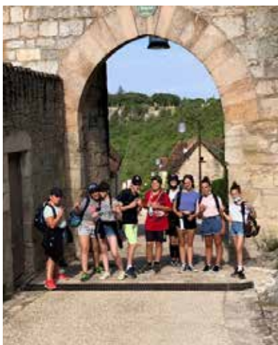
Séjour à Aynac

L'équipe sera ravie d'accueillir les jeunes et leurs familles.