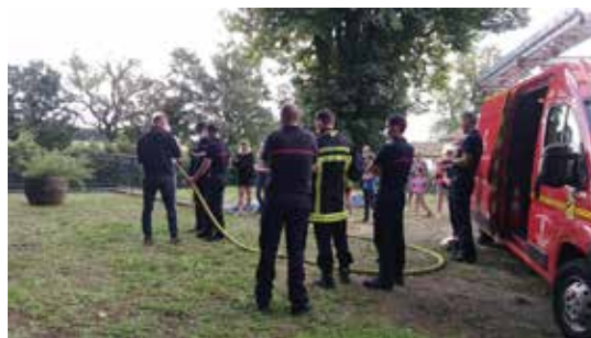
Manoeuvre de pompiers