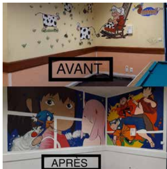
Travaux de décoration de la Maison des Jeunes