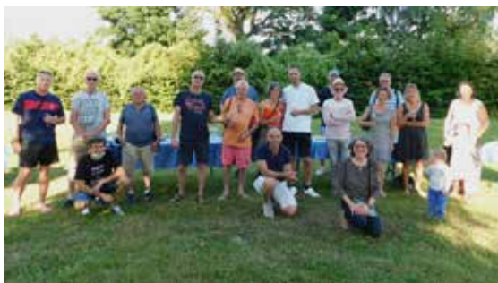
Dégustation de vins