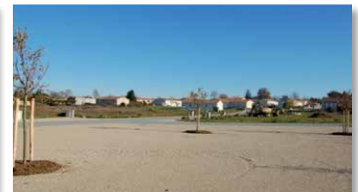
Extension Pré Bourreau 3