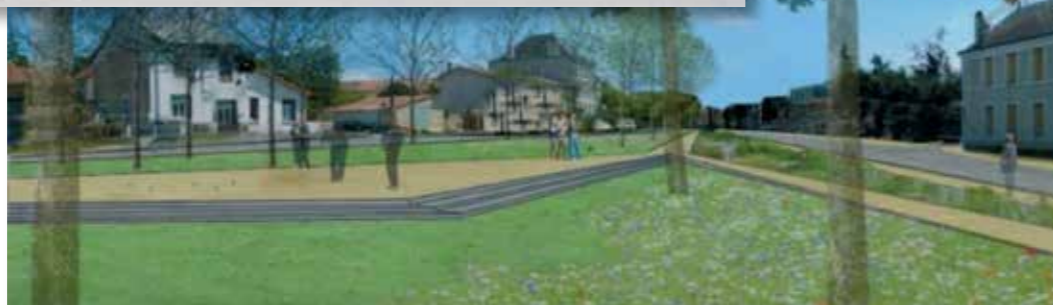
Projet aménagement Place de la Chaume