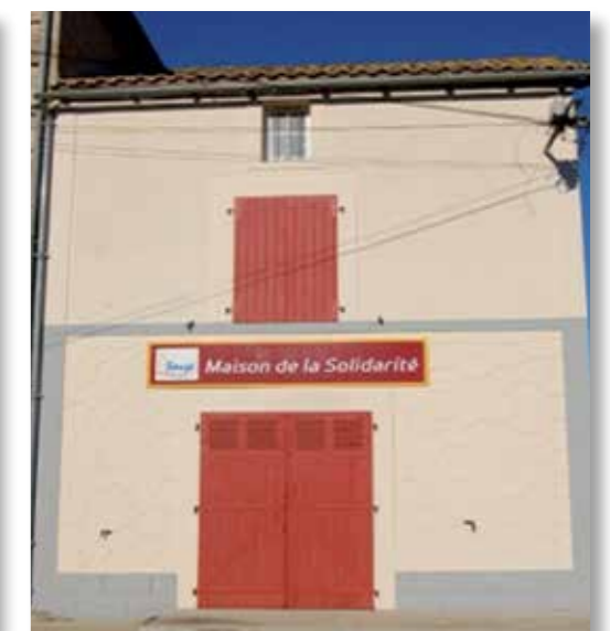
Maison de la solidarité