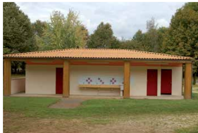
Bloc sanitaire camping