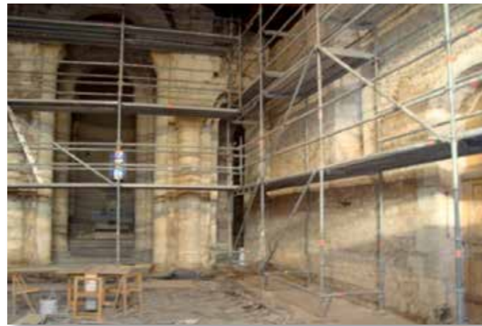
Travaux intérieur Eglise de Vaussais