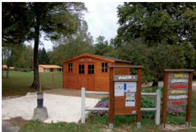
Entrée Village vacances