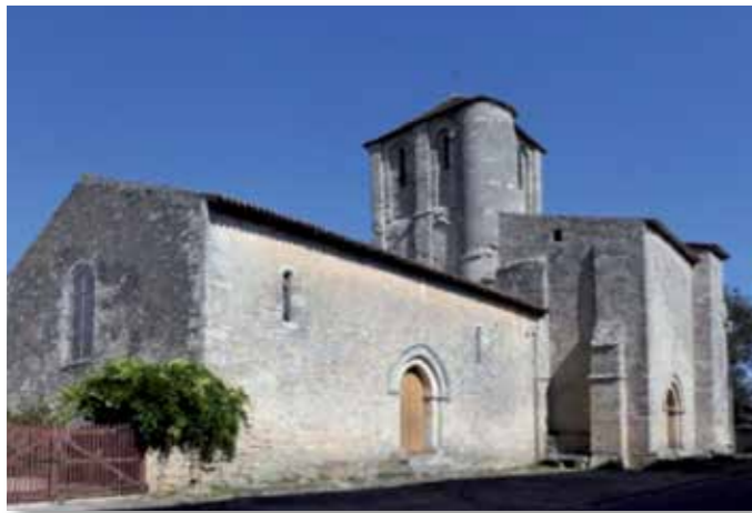
Eglise St Junien de Vaussais