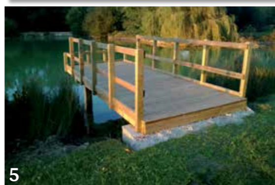
Niveau d'eau le plus bas