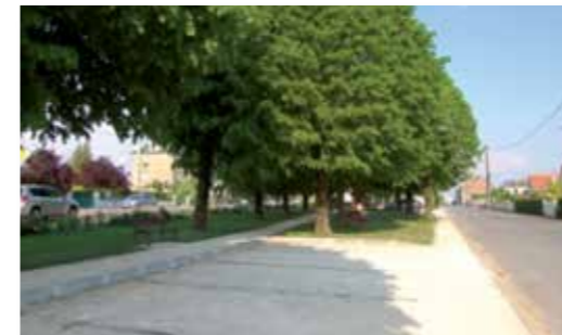
Square Rue de Limage