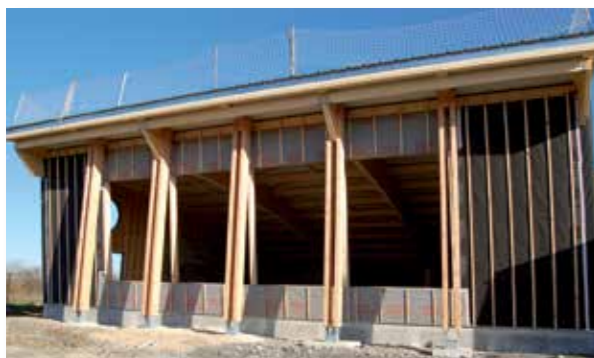
Le gymnase sort de terre