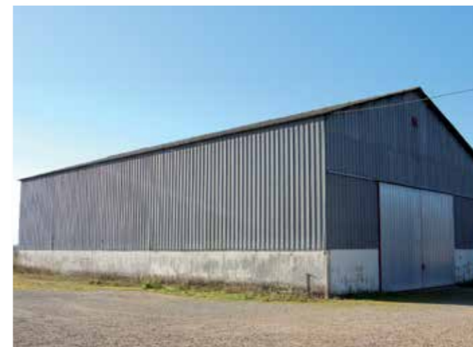
Bâtiment pour véhicules associatifs