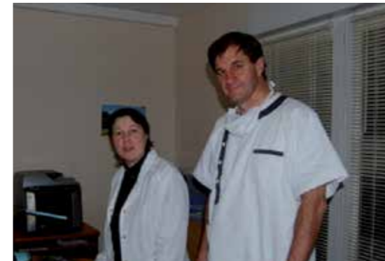
Accueil du dentiste