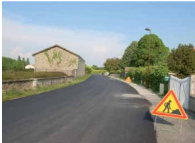
Réfection rue de l'Église