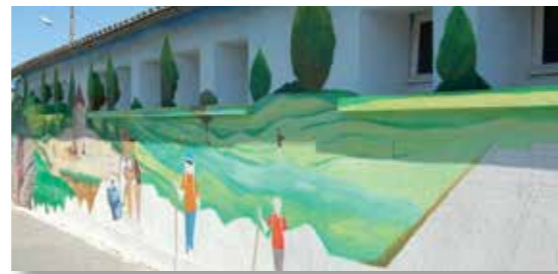
Fresque sur bâtiment communal