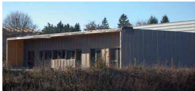
La caserne des pompiers en construction