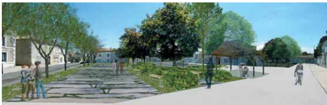
Projet aménagement Place de la Poste