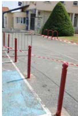
Peinture des poteaux place de la Poste