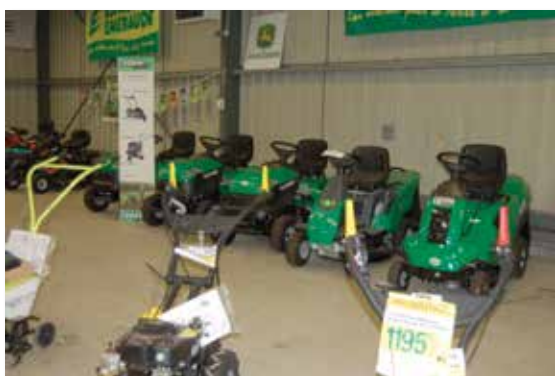
Magasin de Charroux