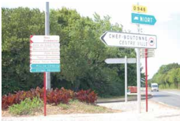
Carrefour D 948 - Rue de la Chevalonnerie

Enfin, les mâts ont été peints de couleur bordeaux. Le coût total s'élève à environ 6 000 euros TTC. Le mobilier urbain, les poteaux place de la Poste, les bancs publics vont être repeints dans le même ton couleur bordeaux afin d'harmoniser et d'embellir notre commune.