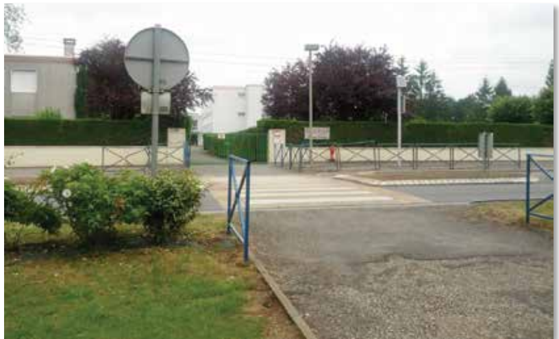
RD 948- Entrée du Collège Anne Frank