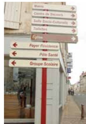
Angle Rue du Baron Grand Rue