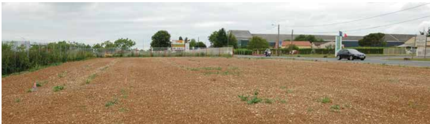
Espace en cours d'aménagement à l'entrée de Sauzé-V dans la Zone d'activités

Un projet de plus grande envergure est actuellement en cours de réalisation sur un terrain propriété de M. Christophe Terrassier et mis gratuitement à la disposition de la Commune. Ce terrain se situe à l'entrée de la zone d'activités et les résultats seront visibles dans quelques semaines.