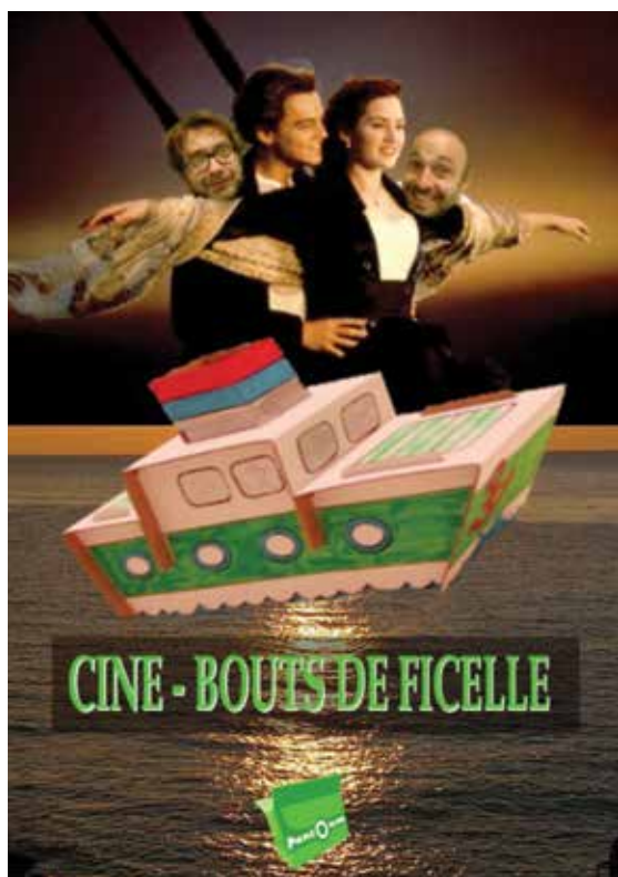
Ciné-Bouts de ficelle

Trois compagnies du Poitou-Charentes seront présentes dans le centre bourg