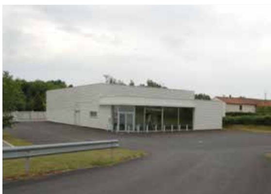
Local avant son installation