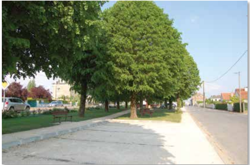
Route de Limage

Il n'est pas possible de multiplier les panneaux !!