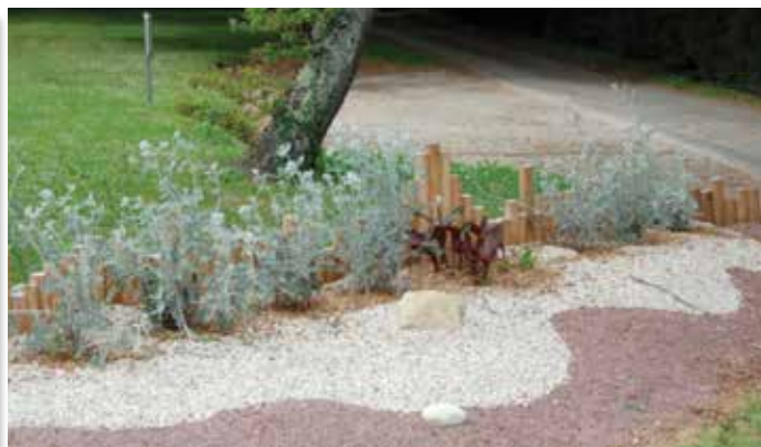
Espaces aménagés à l'entrée du Village Vacances.

Un projet de plus grande envergure est actuellement en cours de réalisation sur un terrain propriété de M. Christophe Terrassier et mis gratuitement à la disposition de la Commune. Ce terrain se situe à l'entrée de la zone d'activités et les résultats seront visibles dans quelques semaines.